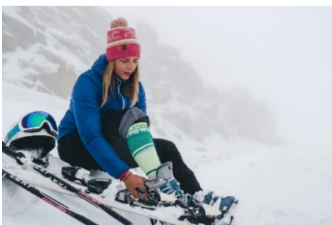
neuem Design HW 23/24.

Bei den Funktionssocken punktet P.A.C. mit neuen, mutigen Designs. Skifahren, Laufen, Biken und Wandern – jetzt kommt „von Kopf bis Fuß“ noch mehr Style ins Spiel.