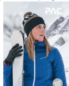
Katalog Sport Winter 2023/24. Stil trifft Funktion & Nachhaltigkeit.

reitet. Statt Unmengen an neuem Garn herstellen und beschaffen zu müssen, kann damit ein Teil des Materials wiederverwendet werden. Das reduziert den Abfall einerseits und verringert andererseits die Produktion von neuem Material. Energie- und Wasserverbrauch sind geringer. Plastik wird aus dem Mittelmeer gefischt und recycelt und gehört schon seit einigen Jahren zum Materialmix bei P.A.C. . Es findet nun Verwendung auch in Strickmützen.