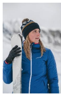
Bild links : Skisocke SK 9.2 Merino Extra Warm im neuen Design im HW 23/24