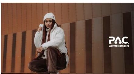
Katalog Knitwear Winter 2023/24 Mit jeder Kollektion steigt der Anteil an recyceltem Material.

In der P.A.C. Kollektion HW 2023/24 wurde der Anteil an Produkten mit recycelter Wolle, recyceltem