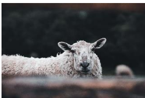
Weniger Zucht, Scheren, Landflächen, Tierleid – recycelte Wolle hat viele Vorteile und spart Emissionen ein.

Mit recycelter Wolle beschreitet P.A.C. neue Wege beim Thema Nachhaltigkeit für Textilaccessoires. Wolle ist nach wie vor das Lieblingsmaterial bei Mützen & Co. Wolle ist zwar ein Naturprodukt. Aber auch hier werden Ressourcen verbraucht.